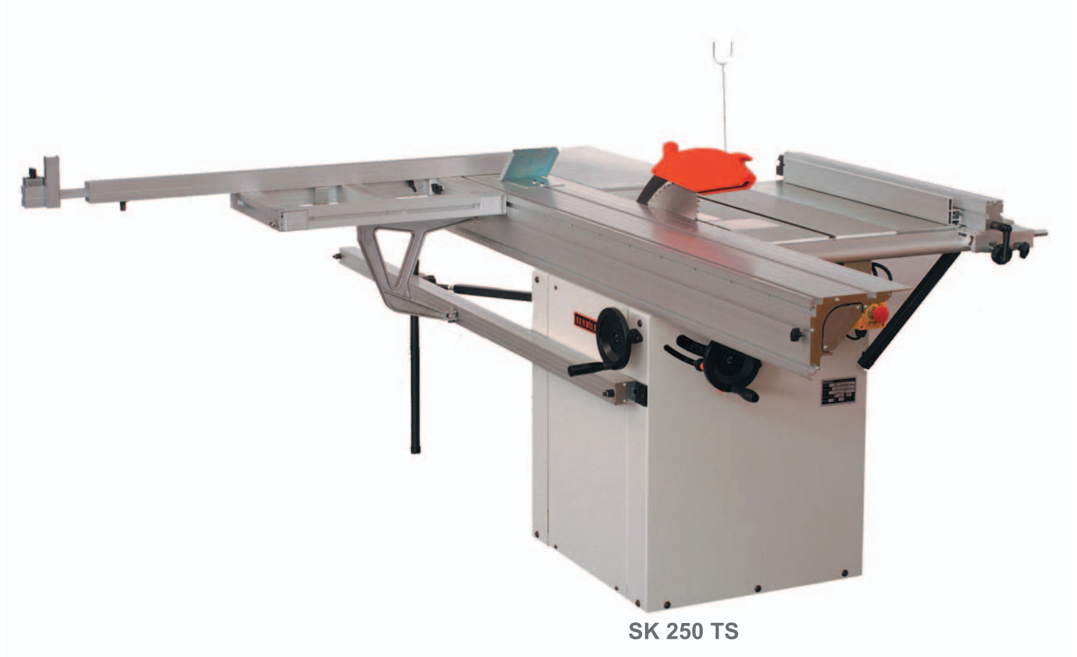
SK 250 TS