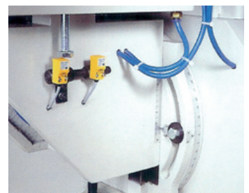
Guías o deslizamientos de precisión