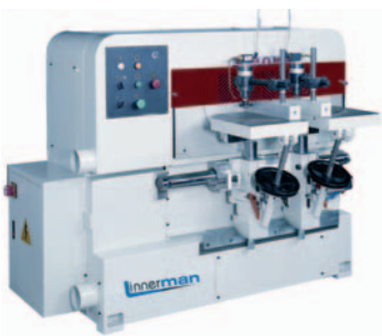
ESPIGADORA DOBLE SILLERIA LINNEMAN MOD. 115 (VER PAG. 39)